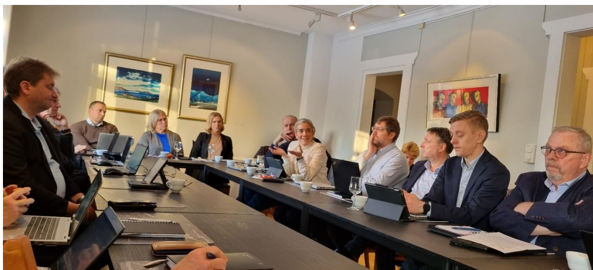
Engasjert diskusjon mellom kommunene i Ring 4 samarbeidet

Selv enkelte av ordførerne som deltok var kritiske til egne partifellers håndtering av veipolitikken. For eksempel kom det sterke reaksjoner på klattvis utbygging og mangel på helhetlige løsninger. Det ble minnet om at riggekostnadene ofte ligger på 20 – 30 % i forbindelse med veiutbyggingsprosjekt. Da er det dårlig økonomi å rigge opp og ned med kort tids mellomrom istedenfor å gjøre ting skikkelig, sammenhengende og helhetlig når man er i gang.